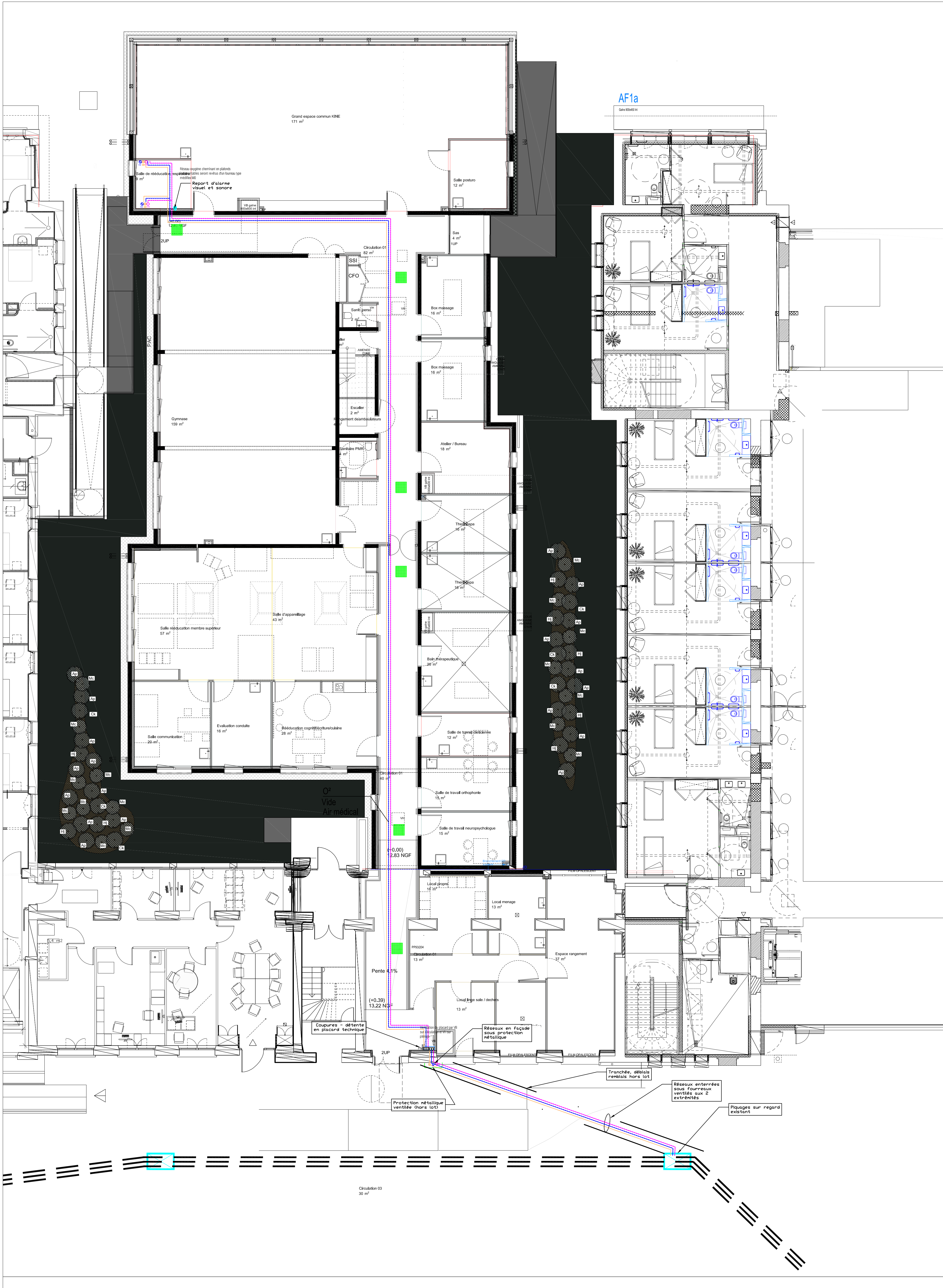
RdC - 1:100